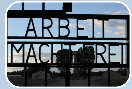
Klasse 9 Demokratie und Diktatur