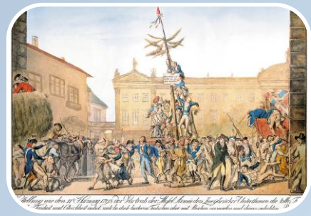
Klasse 8 Epochen-vertiefung