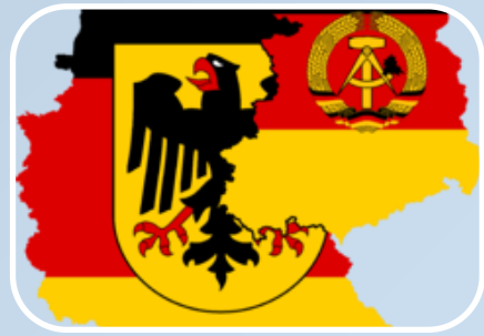
Klasse 10 Kalter Krieg