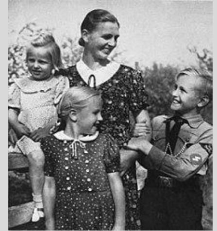
Abb. 14: Frau mit drei Kindern 1930er