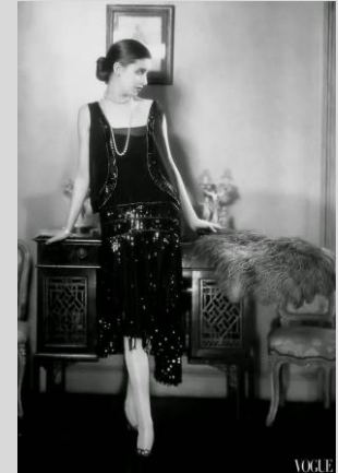
Abb. 12: Frau 1920er