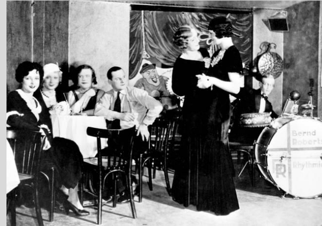
Abb. 7: lesbisches Paar