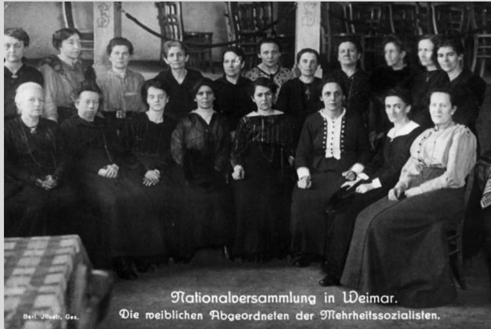
Abb. 5: weibliche MSPD-Abgeordnete der Nationalversammlung