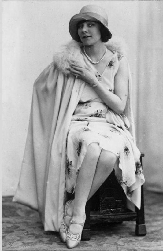
Abb. 1: Bild einer Frau in den 1920er Jahren

vertreten in Literatur, Musik, Theater und Film als Heldinnen