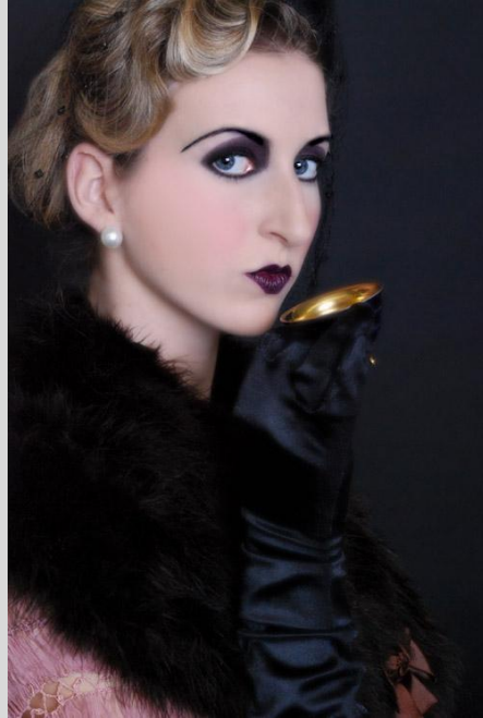
Abb. 9: Make-up