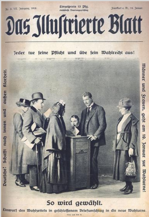
Abb. 3: Aufruf zum Wählen in einer Zeitung