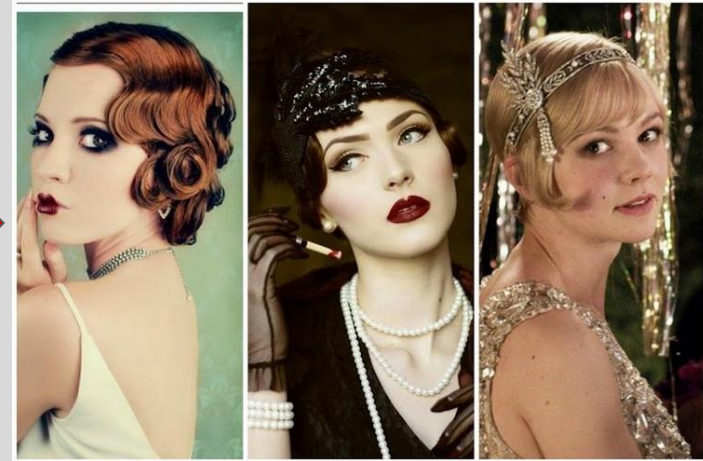
Abb. 10: Frisuren