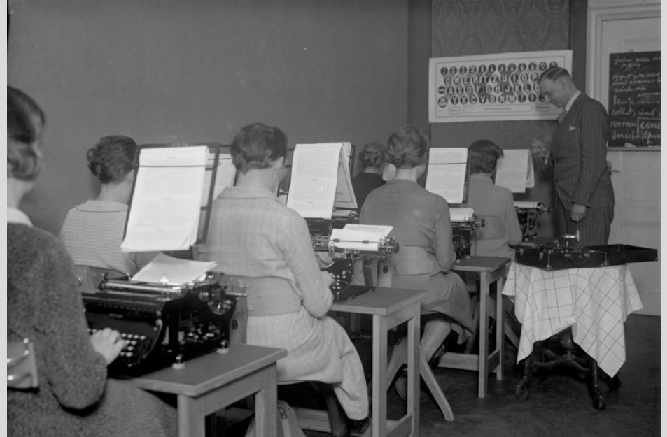
Abb. 6: Tippfräuleins