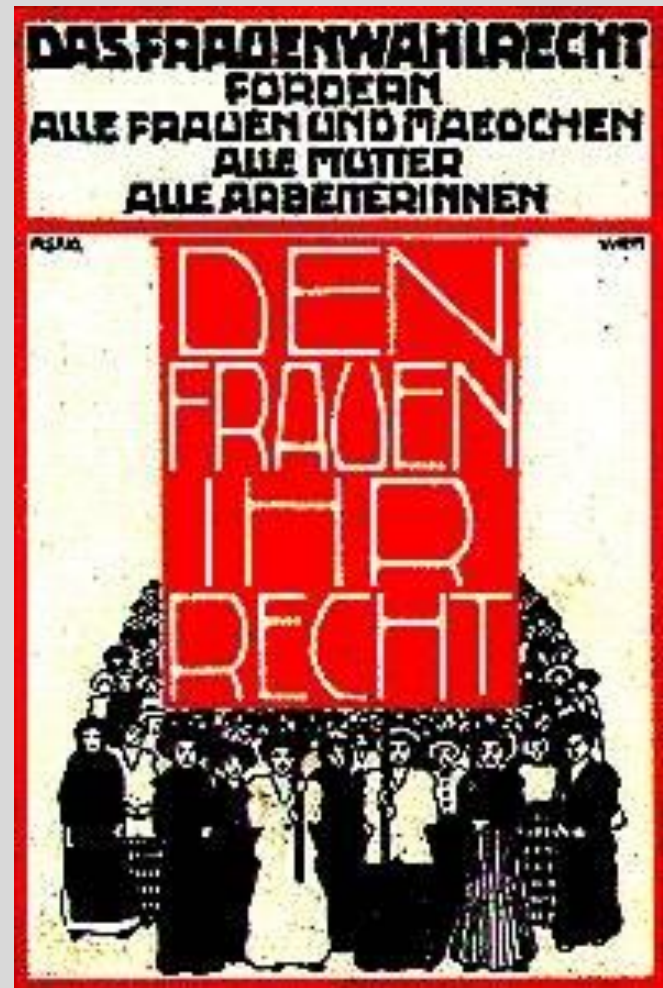
Abb. 2: Kampfplakat für das Frauenwahlrecht