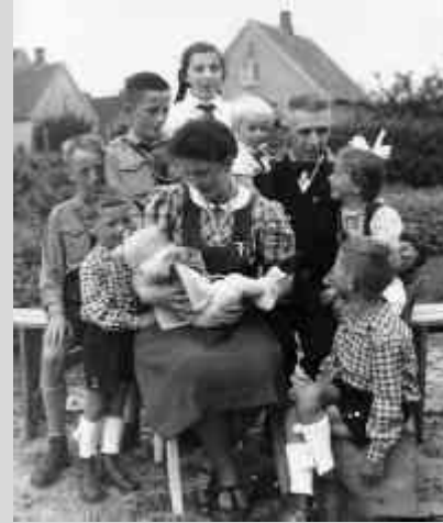
Abb. 13: Familie 1930er

Die deutschen Frauen wollen[...] in der Hauptsache Gattin und Mutter, sie wollen nicht Genossin sein, wie die roten Volksbeglucker es sich und ihnen einzureden versuchen. Sie haben keine Sehnsucht nach der Fabrik, keine Sehnsucht nach dem Büro und auch keine Sehnsucht nach dem Parlament. Ein trautes Heim, ein lieber Mann und eine Schar glücklicher Kinder steht ihrem Herz näher.“ (Curt Rosten, „Das ABC des Nationalsozialismus“, Berlin, 1933)