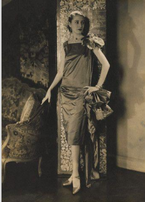
Abb. 8: Kleidung