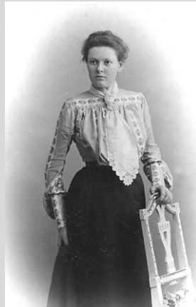
Abb. 11: Frau 1904