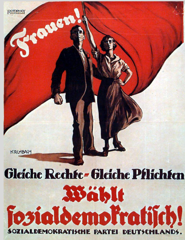
Abb. 4: Aufruf zum Wählen an die Frauen